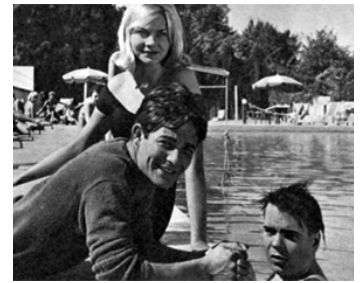
1959 LA MAIN CHAUDE de Gérard Oury avec Macha Méryl, Michael Lonsdale