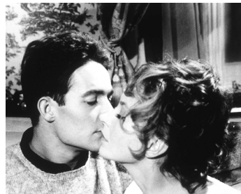
1962 À CAUSE, À CAUSE D'UNE FEMME de Michel Deville avec Marie Laforêt