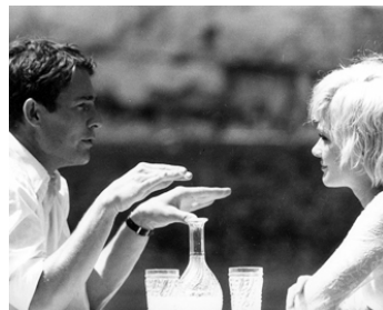
1964 MARIE-SOLEIL d'Antoine Bourseiller avec Danièle Delorme