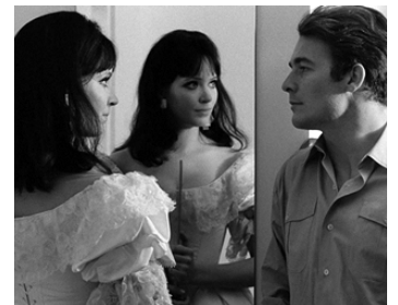
1967 LE PLUS VIEUX MÉTIER DU MONDE, Anticipation de J.-L. Godard avec Anna Karina