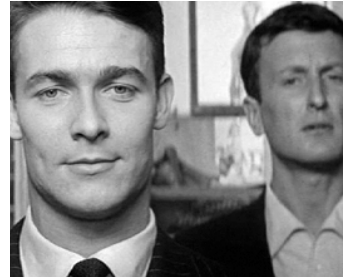
1961 LES 7 PÉCHÉS CAPITAUX, L'Avare de Claude Chabrol avec Claude Rich