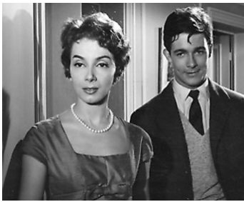
1958 LES TRICHEURS de Marcel Carné avec Andréa Parisy