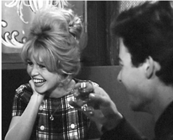
1960 L'AFFAIRE D'UNE NUIT d'Henri Verneuil avec Brigitte Bardot