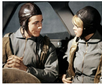
1958 BABETTE S'EN VA-T-EN GUERRE de Christian-Jaque avec Brigitte Bardot