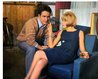
1966 À BELLES DENTS de Pierre Gaspard-Huit avec Mireille Darc