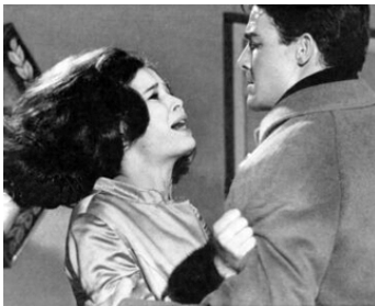
1963 LA VIE CONJUGALE, Jean-Marc d'André Cayatte avec Marie-José Nat