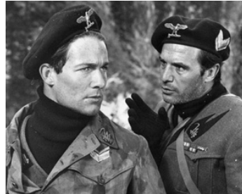
1960 COMMANDO TRAQUÉ (Tiro al piccione) de Giuliano Montaldo avec Francisco Rabal