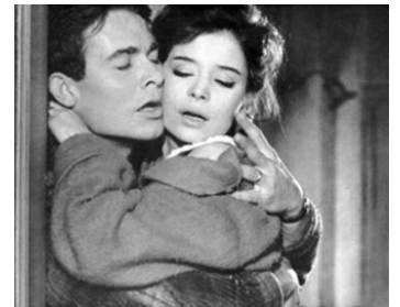
1963 LA VIE CONJUGALE, Françoise d'André Cayatte avec Marie-José Nat