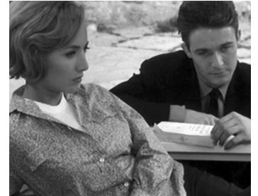
1961 L'ŒIL DU MALIN de Claude Chabrol avec Stéphane Audran