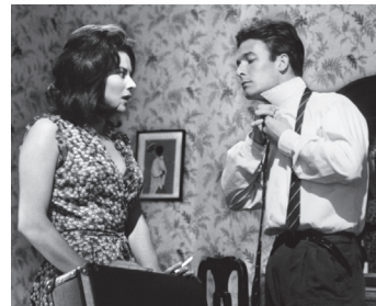
1962 CARMEN 63 (Carmen di Trastevere) de Carmine Gallone avec Giovanna Ralli