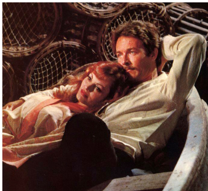
1972 LES VOLETS CLOS de Jean-Claude Brialy avec Catherine Rouvel