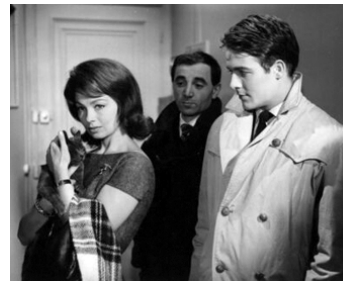
1958 LES DRAGUEURS de Jean-Pierre Mocky avec Dany Robin, Charles Aznavour